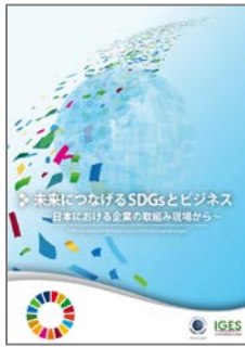
GCNJ・IGES 共同調査レポート

GCNJ・IGES 共同調査レポート 2017 年度版「未来につながる SDGs とビジネス～日本における企業の取組み現場から～」を発売！