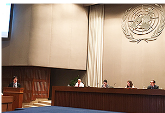
第 5 回 APFSD の様子

2018 年 3 月 28 日～30 日にタイ・バンコクで「 第 5 回持続可能な開発に関するアジア太平洋フォーラム (APFSD) 」(主催：国連アジア太平洋経済社会委員会 [UNESCAP]) が、「持続可能でレジリエントな社会への変革」をテーマに開催されました。APFSD は、今年 7 月に開催される「ハイレベル政治フォーラム (HLPF2018)」の重要な準備会合の 1 つであり、SDGs のゴール 6 (水と衛生)、ゴール 7 (エネルギー)、ゴール 11 (都市)、ゴール 12 (消費・生産)、ゴール 15 (陸域生態系)、ゴール 17 (実施手段) に対するアジア太平洋地域の見通し等について議論しました。