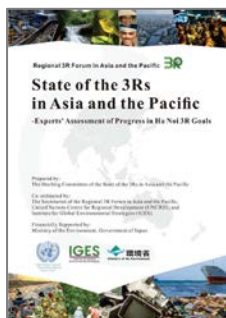
アジア太平洋 3R 白書

本レポートでは、日本、中国、インド、タイ、太平洋島嶼国地域を含む 11 カ国と 1 地域の 3R 政策を共通の指標に基づき評価。SDGs のゴール 12 に沿って、廃棄物の抑制、リサイクル、バイオマスの利用、海洋プラスチックの抑制、電子廃棄物の管理に関連して、アジア太平洋地域における廃棄物と資源効率性に関わる政策の進捗を確認し、廃棄物管理・資源効率性をさらに改善するための 9 つの具体的な提言を示しています。