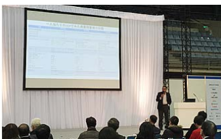
アジア・太平洋エコビジネスフォーラムの様子

2月1日～2日にかけて、川崎市は、「 川崎国際環境技術展 2018 」と「 第 14 回アジア・太平洋エコビジネスフォーラム 」を開催しました。川崎国際環境技術展は、国内外の環境問題に即応する環境技術から地球環境問題を解決する最先端の環境技術まで幅広く展示を行い、ビジネスマッチングの場を提供するものです。アジア・太平洋エコビジネスフォーラムは、川崎市が取り組んできた工業化による環境汚染のコントロール技術とノウハウを国内外に紹介し、技術移転による国際貢献を図ることを目的とするものです。IGES は技術展に出展するとともに、フォーラムでは国を超えて廃棄物の管理・統制を含む SDGs の推進を支援する IGES の取組み等を紹介しました。