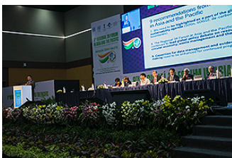
フォーラムの様子

2018 年 4 月 9 日～12 日にインド・インドールで「 第 8 回アジア太平洋 3R 推進フォーラム 」(共催：インド住宅・都市開発省、日本国環境省、国際連合地域開発センター [UNCRD]) が開催されました。「3R と資源効率性で実現するクリーンな水・クリーンな土地・クリーンな空気 -アジア太平洋地域の 21 世紀ビジョン」をテーマに開催されたこのイベントにおいて、IGES と UNCRD は「 アジア太平洋 3R 白書 」を新たに発表しました。