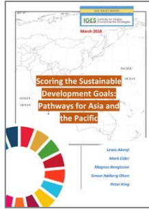
SDGsに関するアジア太平洋地域の道筋についてのレポート