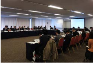
第 6 回 SHM の様子

2018年3月15日に東京で環境省主催（IGES 共催）「持続可能な開発目標（SDGs）ステークホルダーズ・ミーティング第 6 回会合」が開催されました。ステークホルダーズ・ミーティングは、環境側面からの SDGs の実施を推進するために、民間企業や自治体、NGO などの様々な立場から先行事例を共有して認め合い、さらなる取組の弾みをつける場として開催するものです。第 6 回会合では、SDGs に関する国内外の動向、生物多様性分野における SDGs の取組み、SDGs 達成に向けた ESG 投資の取組みについて、計 8 団体・機関から紹介と構成員・参加者を交えた意見交換が行われました。